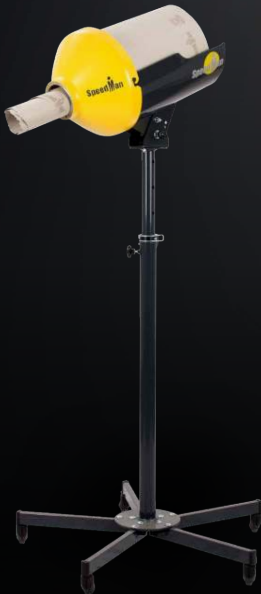
SpeedMan® Classic mit Rollgestell