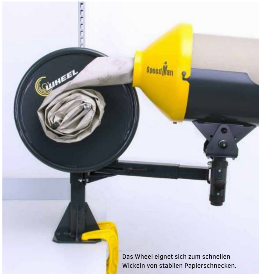
Das Wheel eignet sich zum schnellen Wickeln von stabilen Papierschnocken.