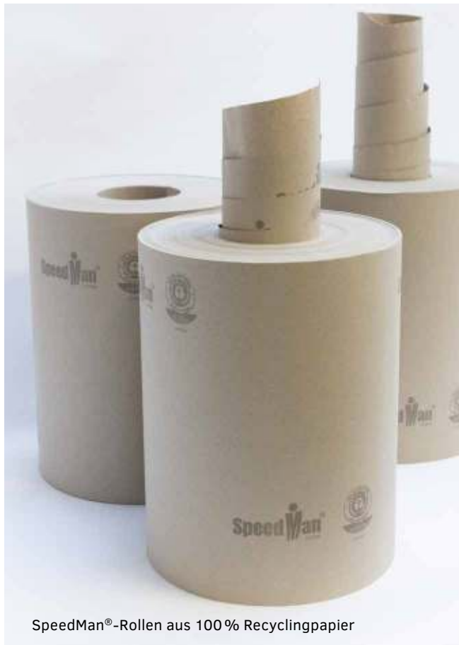
SpeedMan®-Rollen aus 100 % Recyclingpapier